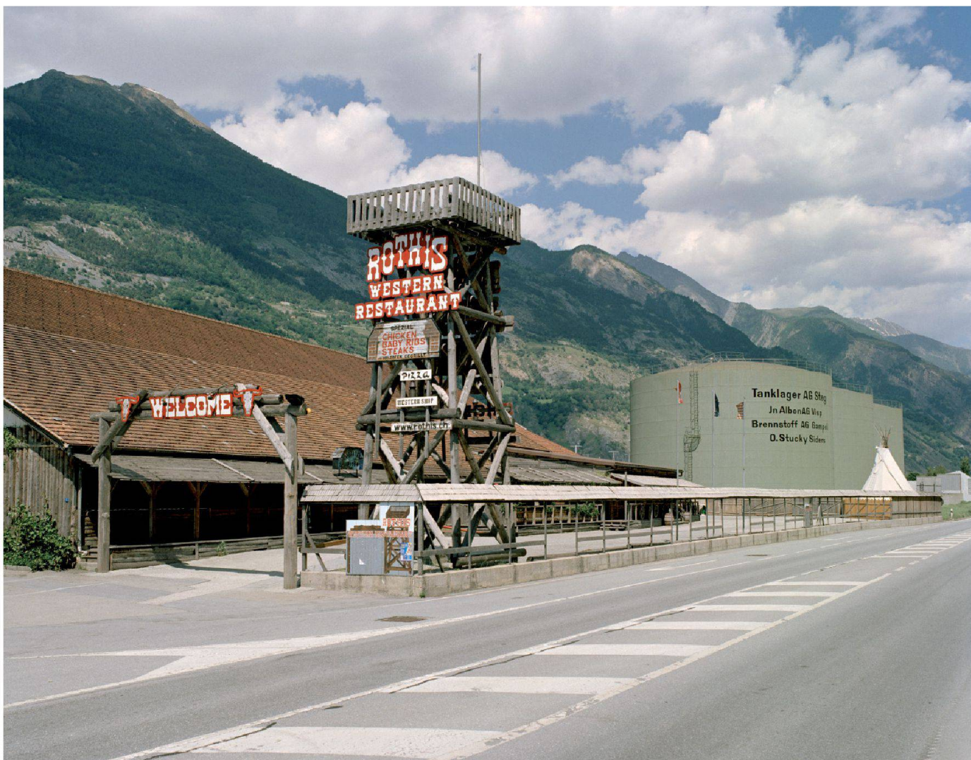
Rothis Western City, Gampel 2005.

Photos et vidéos documentent le paysage helvétique à Winterthour