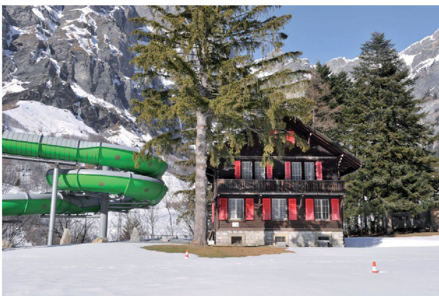
Leukerbad, 2011

Des cimes imposantes, des lacs idylliques, des vallées paisibles – une image classique du paysage suisse que les photographes ont très tôt contribué à façonner. Mais qu'est devenu ce paysage ? L'exposition « Adieu la Suisse ! » de la Fondation suisse pour la photographie documente non seulement le changement réel du paysage helvétique mais aussi l'évolution du regard posé sur lui. La déconstruction des anciens mythes relayés par les photographes a produit de nouvelles images de la Suisse. Réalisée en collaboration avec le Pavillon Populaire/Ville de Montpellier, l'exposition « Adieu la Suisse ! » rassemble des photographies de Jean-Luc Cramatte, Nicolas Faure, Yann Gross, Andri Pol, Christian Schwager, Jules Spinatsch, Martin Stollenwerk, une installation vidéo d'Erich Busslinger ainsi que des photos historiques de la collection de la Fondation suisse pour la photographie. réd.