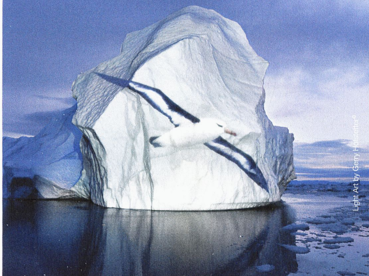
Light Art by Gerry Holschläger