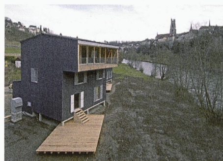
Maisons individuelles en zone inondable à Fribourg de Bakker & Blanc architectes associés, Lausanne Lauréat de la deuxième édition de la DRA.

Dans le courant de l'été 2014, le jury effectuera une première sélection d'une trentaine d'objets. En septembre, le jury annoncera les lauréats et inaugurera l'exposition itinérante qui présentera en Suisse et en Europe le résultat de cette belle initiative. rédi