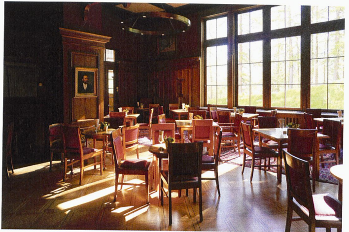
Au bar de l'hôtel Waldhaus Sils