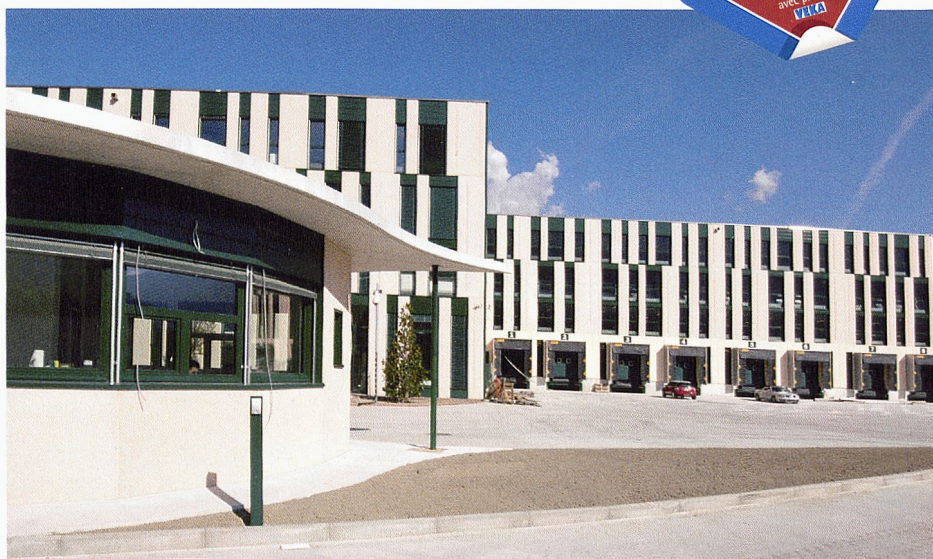
Le nouveau centre logistique Gucci mise sur SOFTLINE 82

D'un point de vue architectural, il était important que le système de fenêtres choisi permette de réaliser des vitres très élancées assurant une luminosité maximale à l'intérieur du bâtiment. D'une part, cette option a pour avantage d'agir positivement sur la sensation générale d'espace. D'autre part, la lumière du jour augmente le bien-être au travail et, par là même, la productivité des collaborateurs. Les fenêtres étroites à battants et feuillure, sélectionnées et fabriquées sur mesure, permettent de disposer dorénavant d'une part de vitrage pouvant atteindre 77% et fournissent ainsi une lumière naturelle agréable dans les différentes halles. La version choisie est baptisée «swisswindows classico alu» et se caractérise