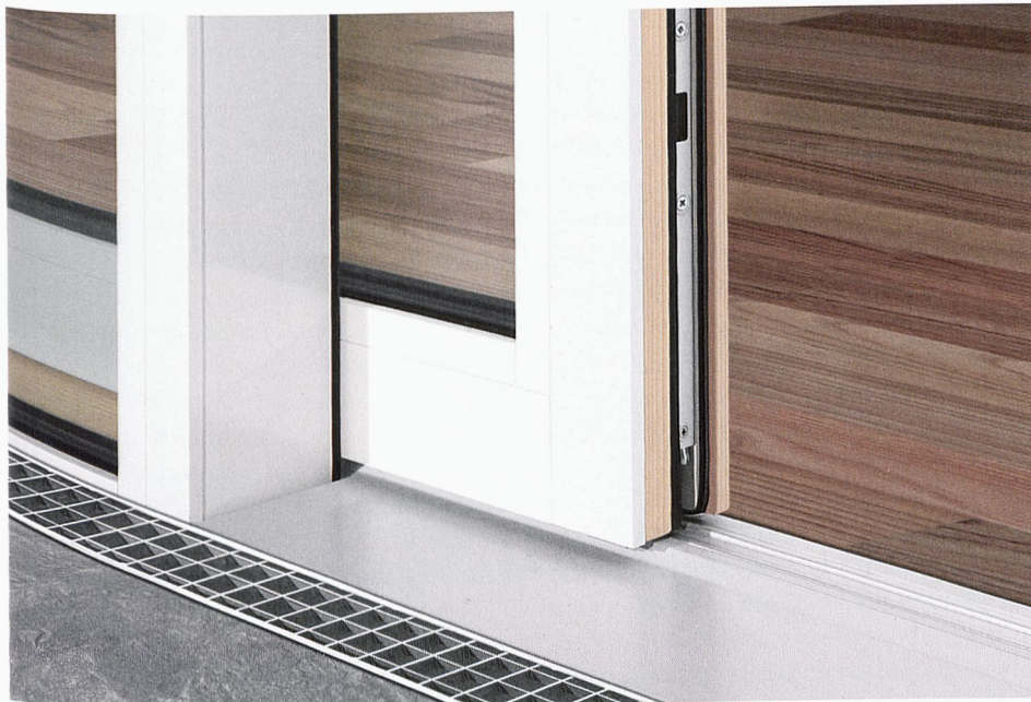
Portes-fenêtres EgoKiefer avec vide lumière maximal et seuils accessibles aux fauteuils roulants.

Les systèmes intelligents améliorent la qualité de vie. L'ouverture et la fermeture automatiques de portes coulissantes à levage ou la construction de seuils accessibles aux fauteuils roulants accroissent le confort et la maniabilité pour tous.