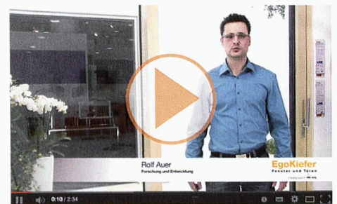
Porte coulissante à levage EgoKiefer XL®2020 en bois/alu et porte coulissante à levage EgoKiefer XL®2020 en PVC/alu.

Vidéos de produits: www.egokiefer.ch/innovations