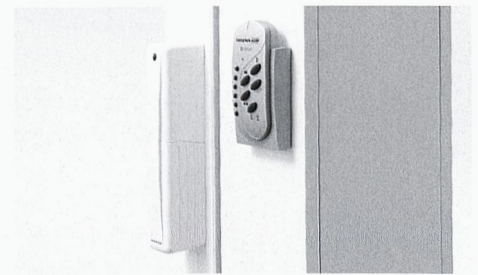
Portes coulissantes à levage avec entraînement motorisé.