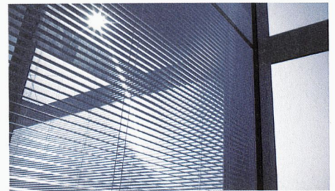
Protection solaire du futur: le store intégré dans le vitrage isolant.

Commandez sans plus tarder la documentation et téléchargez sur www.egokiefer.ch les plans CAD pour votre projet.