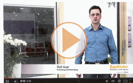
Porte coulissante à levage EgoKiefer XL®2020 en bois/alu et porte coulissante à levage EgoKiefer XL®2020 en PVC/alu.

Vidéos de produits: www.egokiefer.ch/innovations