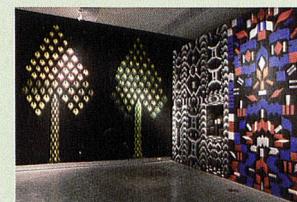
Vue de l'exposition Couture graphique au MOTI - Museum of the Image, Breda, Pays-Bas, 2013

EXPOSITION COUTURE GRAPHIQUE mudac, Lausanne www.mudac.ch