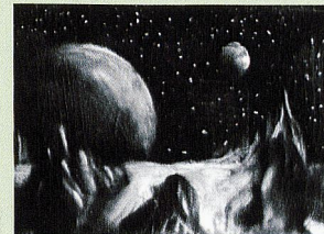
The astronaut (© Marc Bauer)

EXPOSITION ORIENTATIONS. YOUNG SWISS ARCHITECTS SAM Schweizerisches Architekturmuseum, Bâle www.sam-basel.org