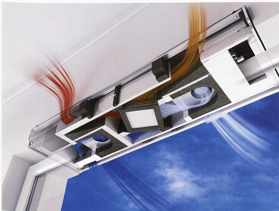
Ego®Fresh, le système d'aération parfait avec récupération de chaleur. Pour un air sain dans les pièces.

Avec son système d'aération multiloaux, EgoKiefer offre une alternative intéressante à l'aération centralisée car Ego®Fresh possède une récupération de chaleur intégrée et est compatible avec MINERGIE®. Ce système permet d'avoir un air sain dans les pièces sans recourir à des canaux d'aération.