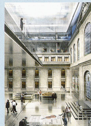
(© Infographie Ateliers Nouvel/Architecture Jucker/ B. Disersens-Jucker)

EXPOSITION RÉNOVER AGRANDIR Projet de rénovation du Musée d'art et d'histoire Musée d'art et d'histoire, Genève www.ville-geneve.ch