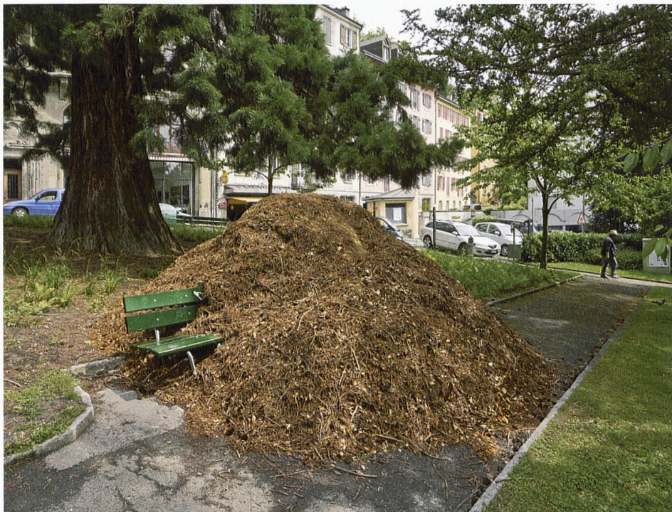
Dehors d'un bois