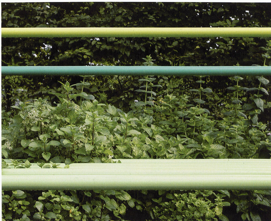
L'île verte

Le jardin implanté sur le terrain de la Vigie, un boulo-drome encore en activité, est l'un des seuls de Lausanne Jardins qui ait valeur d'usage. L'intervention est simple, mais elle fonctionne : des tubes peints dans différents tons de vert servant de bancs ou de barrières, mais aussi des plantations – anis, menthe, sauge, asperge et absinthe – en libre-service, des éléments existants repeints et quelques cartes postales que le visiteur peut emporter. Les tubes peints évoquent les systèmes de tuyauterie des bâtiments – sorte de mini Beaubourg –, comme s'ils prolongeaient les conduites souterraines de la ville. C'est sans doute à partir de l'usage du lieu que les concepteurs ont pensé ce jardin, en employant un vocabulaire issu de la ville puis remodelé. La contrainte est ainsi devenue moteur de création.