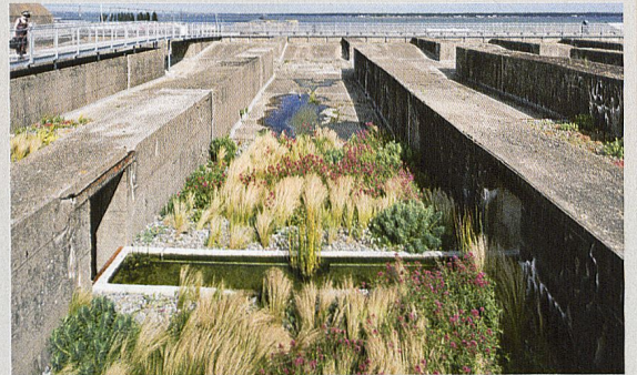
Gilles Clément, Le Jardin du Tiers-Paysage – Le Jardin des Orpins et des Graminées , toit de la base des sous-marins, Saint-Nazaire, création pérenne Estuaire 2012 (© Martin Argyroglo/LVAN)