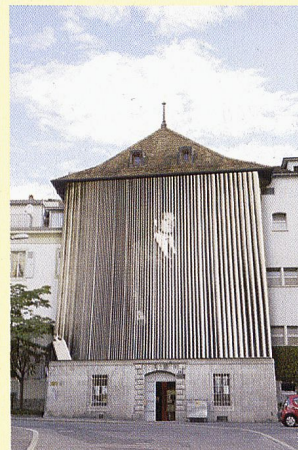
John Baldessari, Figure (with Vertical Lines) , 1999.