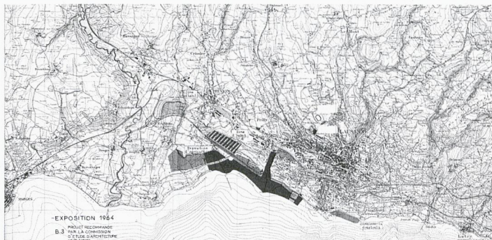
Projet de la Commission d'architecture, 8 janvier 1959

Helios Ventilatoren AG Münsterstrasse 4 • 8112 Otelfingen T. 044 735 36 36 • Fax 044 735 36 37