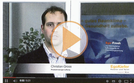
Ego®Fresh, le système d'aération multiloaux compatible avec MINERGIE®

MINERGIE® EgoKiefer est partenaire LEADING PARTNER principal de MINERGIE®