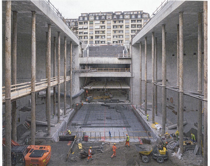
Halte de Champel-Hôpital