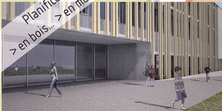
Ecole du Martinet, Rolle