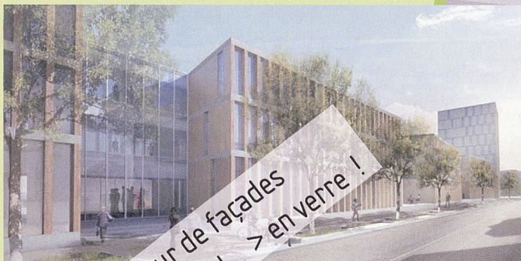
Campus HE, Delémont