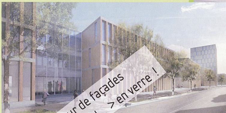
Campus HE, Delémont