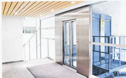
Residenza Laret à Saint-Moritz: Tout aussi convaincant sur le plan esthétique: façades en verre et acier chromé.