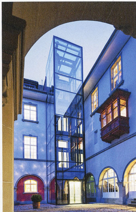
Musée d'histoire et du folklore de Saint Gall: La modernité de la cage d'ascenseur en verre contraste avec le bâtiment historique.

Un certain nombre d'idées originales ont également dû être trouvées pour mettre à jour la desserte d'une résidence en terrasses de plus de vingt ans à St-Moritz. Une solution surprenante a été trouvée: AS