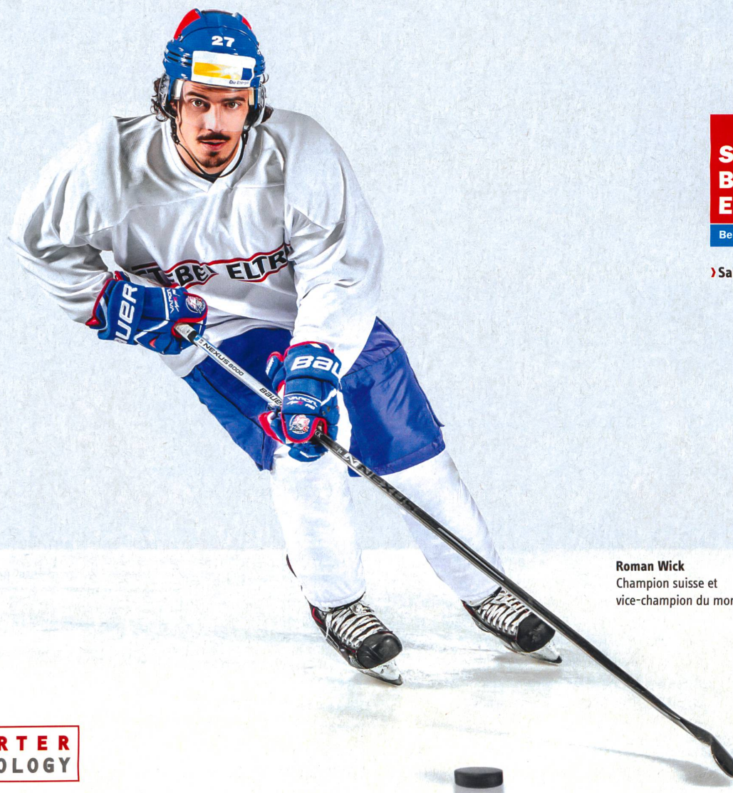
Roman Wick Champion suisse et vice-champion du monde