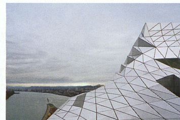
Couverture: Façade pignon en béton apparent du MEG à Genève; 4 e de couverture: sur la toiture du musée des Confluences à Lyon