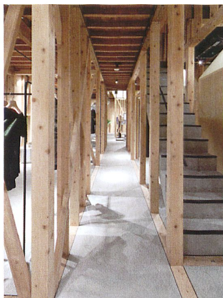
Boutique Isabel Marant, Tokyo - Omotesando (© Cigüe, 2012)

Villa Noailles, Hyères www.villanoailles-hyeres.com