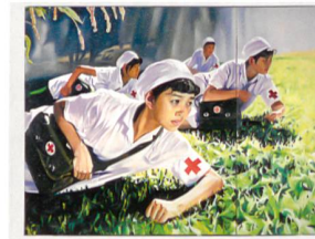
Jing Keven, Dream 2008, N°1 (Nurses), 2008

EXPOSITION CHINESE WHISPERS Œuvres récentes des collections Sigg et M+ Sigg Musée des Beaux-Arts de Berne et Zentrum Paul Klee www.zpk.org