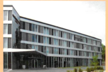
Hôtel Modern Times, St-Légier