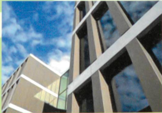
STRATE J, Delémont