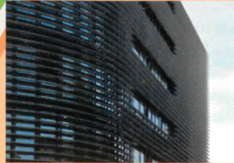
La Croisée, Renens