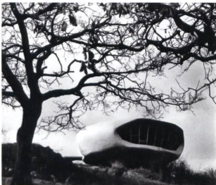
Pascal Häusermann, pavillon de week-end expérimental, Grilly, 1959