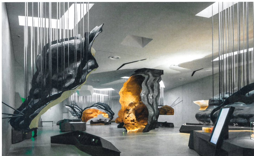
© Luc Bongly &amp; Sergio Grazia photographers