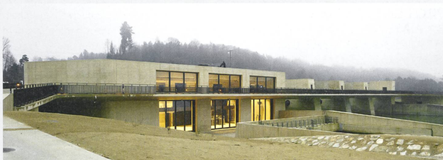
La salle des machines de la centrale électrique de Hagneck est intégrée au barrage. Le franchissement du barrage fait office de trait d'union cyclable entre les deux berges du lac de Bière.

En règle générale, les débris apportés par l'eau sont extraits à l'aide d'une grande grille filtrante avant d'être entassés dans des conteneurs habituellement disposés dans la zone d'entrée de la centrale. Mais pour nous, cette option n'était pas envisageable d'un point de vue esthétique. Nous avons donc cherché une solution qui soit à la fois plus pratique et plus favorable à l'harmonie visuelle.