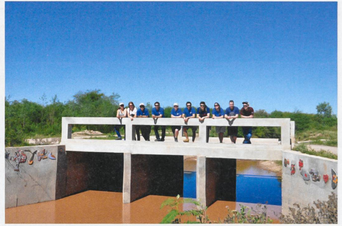
Les membres d'Ingénieurs sans frontières sur le plus grand des deux ponts construits à Colonia Dora. Cette photo a été prise au printemps 2015, lors du lancement du projet suivant dans la région.

durable des projets réalisés. Seules l'application et l'optimisation des méthodes et des techniques disponibles localement permettent d'obtenir l'implication de la population. » Les deux ingénieurs sont persuadés que la motivation et l'engagement des habitants sont la clé de la réussite. Et avoir un projet permet à ces derniers de s'affranchir de l'aide de la Suisse.