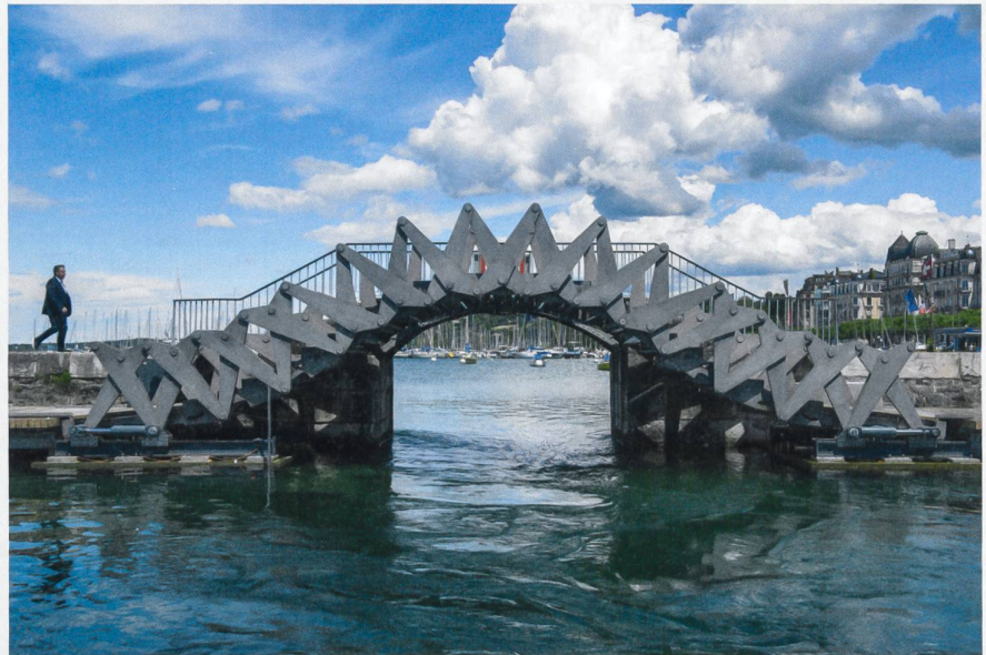
La passerelle mobile du ponton du Jet d'eau de Genève.