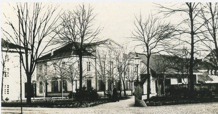
Le Casino d'Aarau (1869): lieu de fondation de la SIA

Depuis presque 50 ans, la sécurité parasismique en Suisse fait l'objet de prescriptions de la SIA. Ses représentants ne se retrouvent donc pas ce samedi d'avril pour parler de dangers naturels, mais de l'avenir de la Suisse. Lorsque leur association a vu le jour, seules quelque 2,4 millions de personnes occupaient le territoire de la Suisse actuelle. En 2017, elles sont 8,4 millions. « Bâtir pour une Suisse à 10 millions d'habitants » est le défi que les professionnels de la construction doivent maintenant relever et les élus comme les citoyens attendent d'eux des réponses à cette problématique. Le