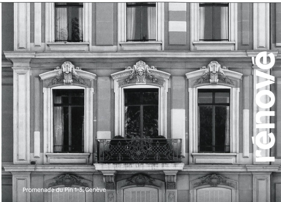
Promenade du Pin 1-3, Genève

charpente fenêtre menuiserie ébénisterie