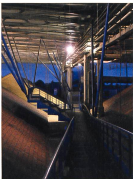
L'espace praticable entre l'ancien et le nouveau toit du Fresnoy.