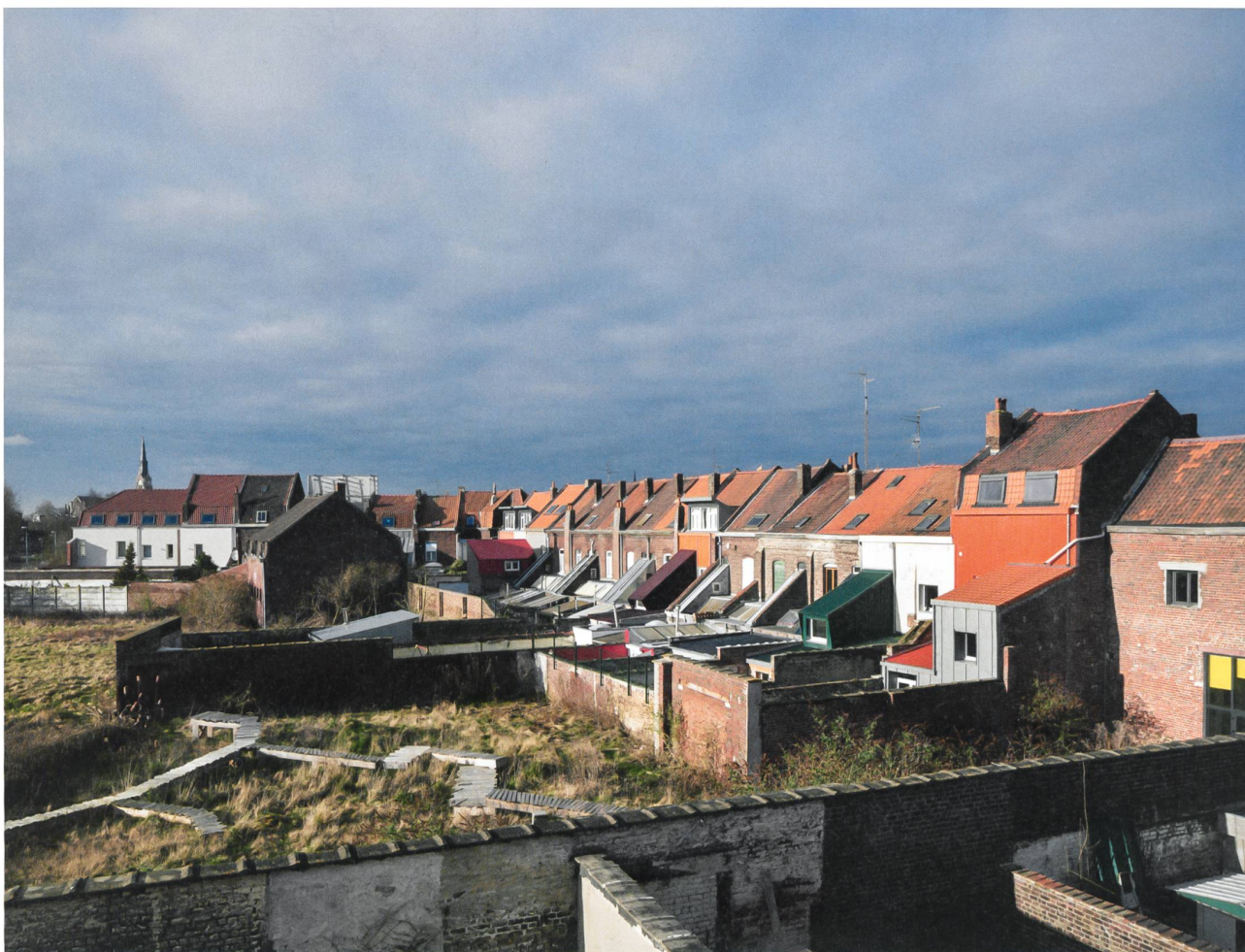
4 Maisons rénovées de l'îlot Stephenson à Roubaix

ensemble homogène. Cette convergence culmine dans la méthode suivie pour passer des idées aux actes. Chacun des projets témoigne en effet de cette cohérence procédurale qui est la marque d'un grand projet d'envergure. Ce grand projet n'est certes pas «l'œuvre architecturale». Il aurait fallu, pour que cela soit le cas, que ces réalisations puissent «faire œuvre». Or Patrick Bouchain refuse le principe même d'un droit de regard sur ses réalisations dès lors que celles-ci ont été livrées à leurs usagers. La cohérence se loge donc ailleurs. Il faut la chercher du côté d'une certaine conception de la démocratie et des moyens d'y parvenir. Bâtir ensemble, c'est-à-dire prendre activement part à la conception de son lieu de vie ou de travail, est pour Patrick Bouchain un principe fondamental, le signe d'une conception active de la démocratie. Il repose sur une conviction inébranlable: l'acte de bâtir est émancipateur. Il préfigure en outre un retour à des méthodes