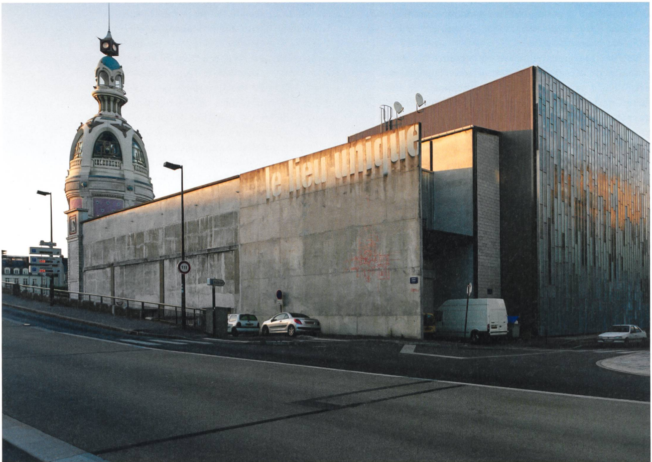
1 Le Lieu Unique à Nantes

normativité qui finit par inclure ce que la norme contournée excluait. Avant l'école foraine de Saint-Jacques-de-la-Lande, construire une école publique en bois était inenvisageable. Aujourd'hui, pour avoir été faite, une telle école est entrée dans la normalité. Il en va ainsi du Lieu Unique à Nantes et du Théâtre équestre Zingaro, deux projets emblématiques parmi la vingtaine qui pourraient servir d'exemples.