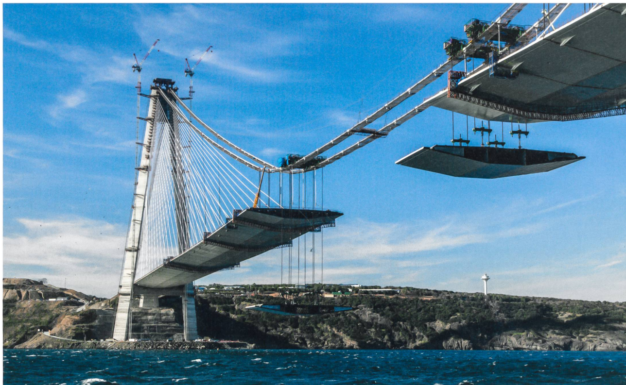
Mise en œuvre du tablier du pont routier et ferroviaire sur le Bosphore conçu par Jean-François Klein (T-ingénierie intl.) et Michel Virlogeux.

L'art des ingénieurs suisses amorce l'étape suivante et prépare son prochain volume, à paraître en novembre 2018, avec des ouvrages parmi les plus réussis, les plus beaux et les plus intéressants, conçus par des ingénieur(e)s suisses et achevés en 2017-2018.