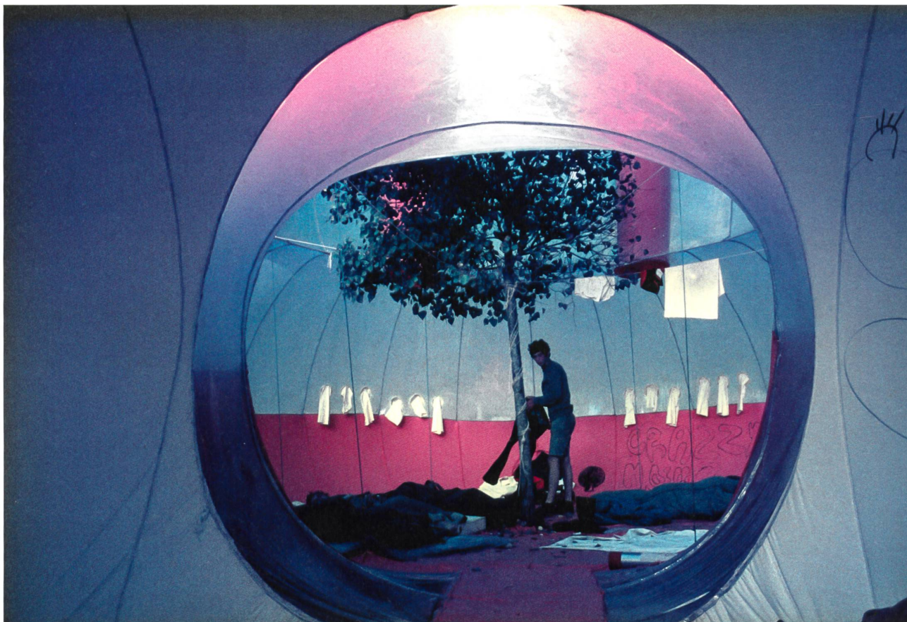
José Miguel de Prada Poole, Instant City (ICSID), Valladolid, Espagne, 1971, photographie numérique

Pour sa première édition, le parcours de la Biennale d'Architecture d'Orléans distingue trois chemins pour atteindre l'architecture: les migrations comme seul destin, l'architecture définie comme ritournelle permanente entre fiction et réalité, et le rêve comme mode opératoire pour aller, au-delà de la catastrophe, à la rencontre de l'autre. C'est à travers