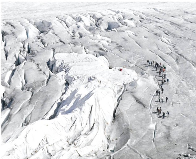
Matthieu Gafsou, série Alpes, 2012