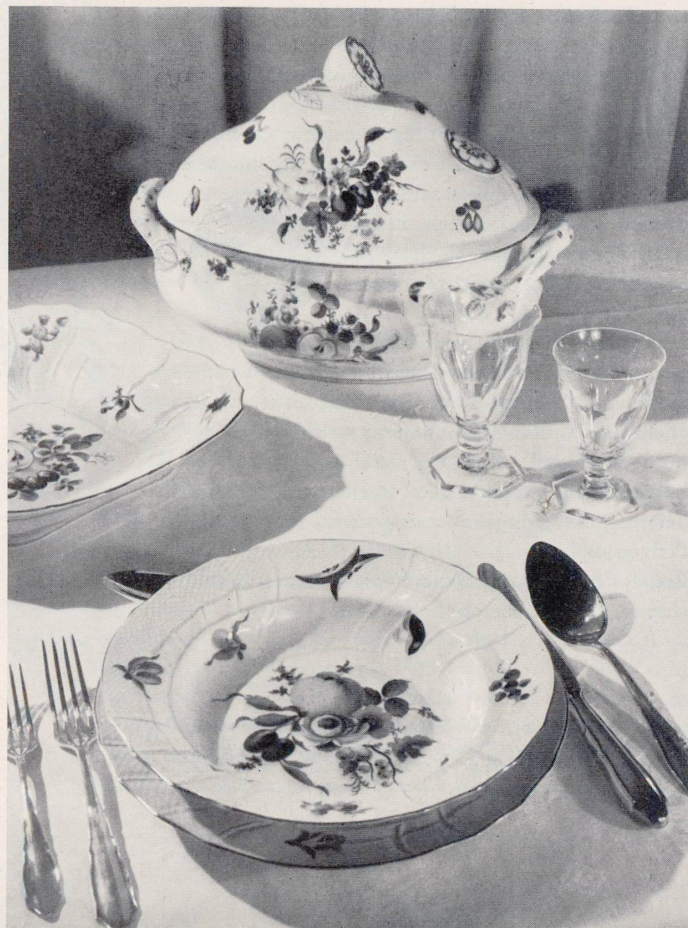
GLAS UND PORZELLAN. AUX ARTS DU FEU, LUZERN - ZÜRICH