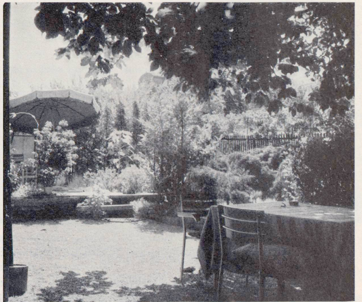
GARTEN G.M. BEI BASEL: Der Wohngartenteil beim Hause mit sonnigen und schattigen Ruheplätzen. Entwurf Ad. Engler, BSG.