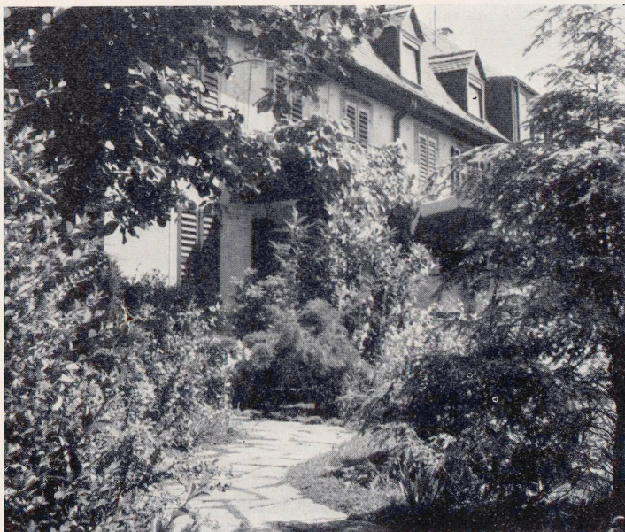
GARTEN G.M. BEI BASEL: Blick aus dem südwestlichen Gartenteil gegen das ins Grün eingebettete Haus. Gartenentwurf Ad. Engler, BSG., Basel