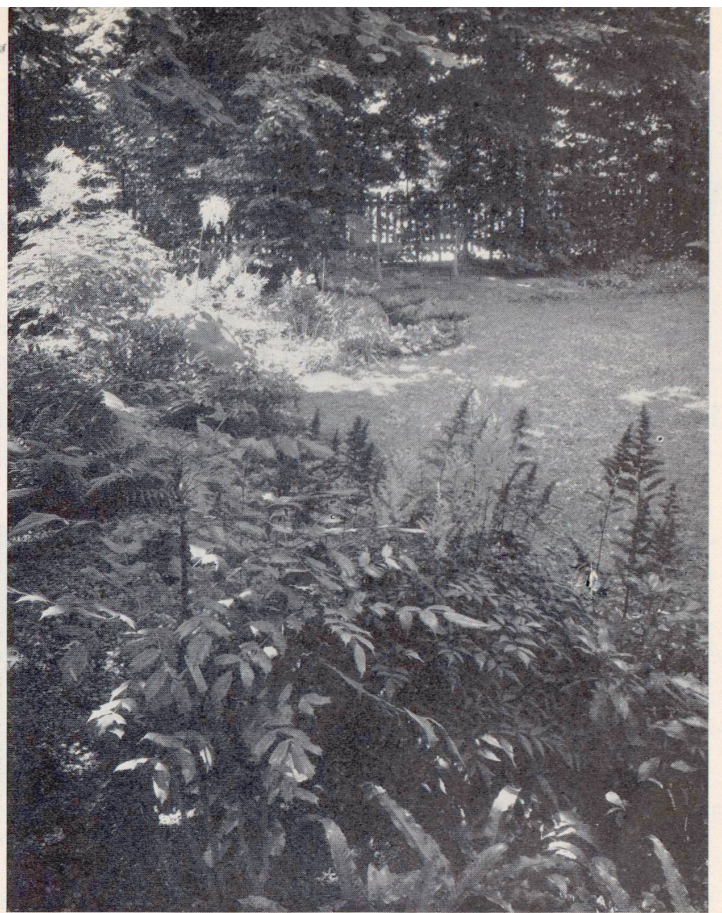
GARTEN G.M. BEI BASEL: Blick in den «Schattengarten mit reichhaltiger Unterpflanzung von Schattengewächsen, wie Astilbe, Aruncus, Astilboides tabularis usw. Entwurf Ad. Engler, BSG., Basel

Der Garten erlaubt uns, das organische Leben zu erkennen und zu genießen. Er bietet den Menschen, welche die Mannigfaltigkeit der freien Natur entbehren, einen reichen Ersatz; – auch die andersartige Pflanzenwelt der Gebirge oder südlichen Gegenden kann an geeigneter Stelle auf kleinem Raum vor uns erstehen, – ja, das Erlebnis des jahreszeitlichen Wechsels, des Wachsens, Blühens,