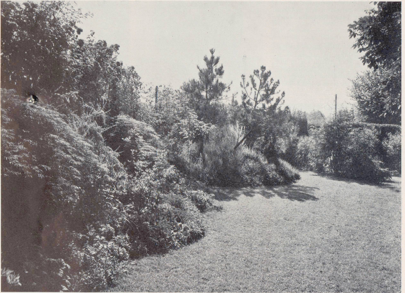
GARTEN G. M. BEI BASEL: Bepflanzung eines Abhangs mit Zwerggehölzen und Polsterpflanzen. Die Pflanzung wurde in ihrer Struktur dem anschließenden Heidegärtchen mit seiner feinlaubigen Vegetation angepaßt. Entwurf Ad. Engler, BSG., Basel

Es dürfte angebracht sein, wenn eine Zeitschrift, die sich mit den verschiedenen Aspekten des heutigen Bauens und Wohnens befaßt, auch einigen grundsätzlichen Betrachtungen über den heutigen Garten Raum gibt.