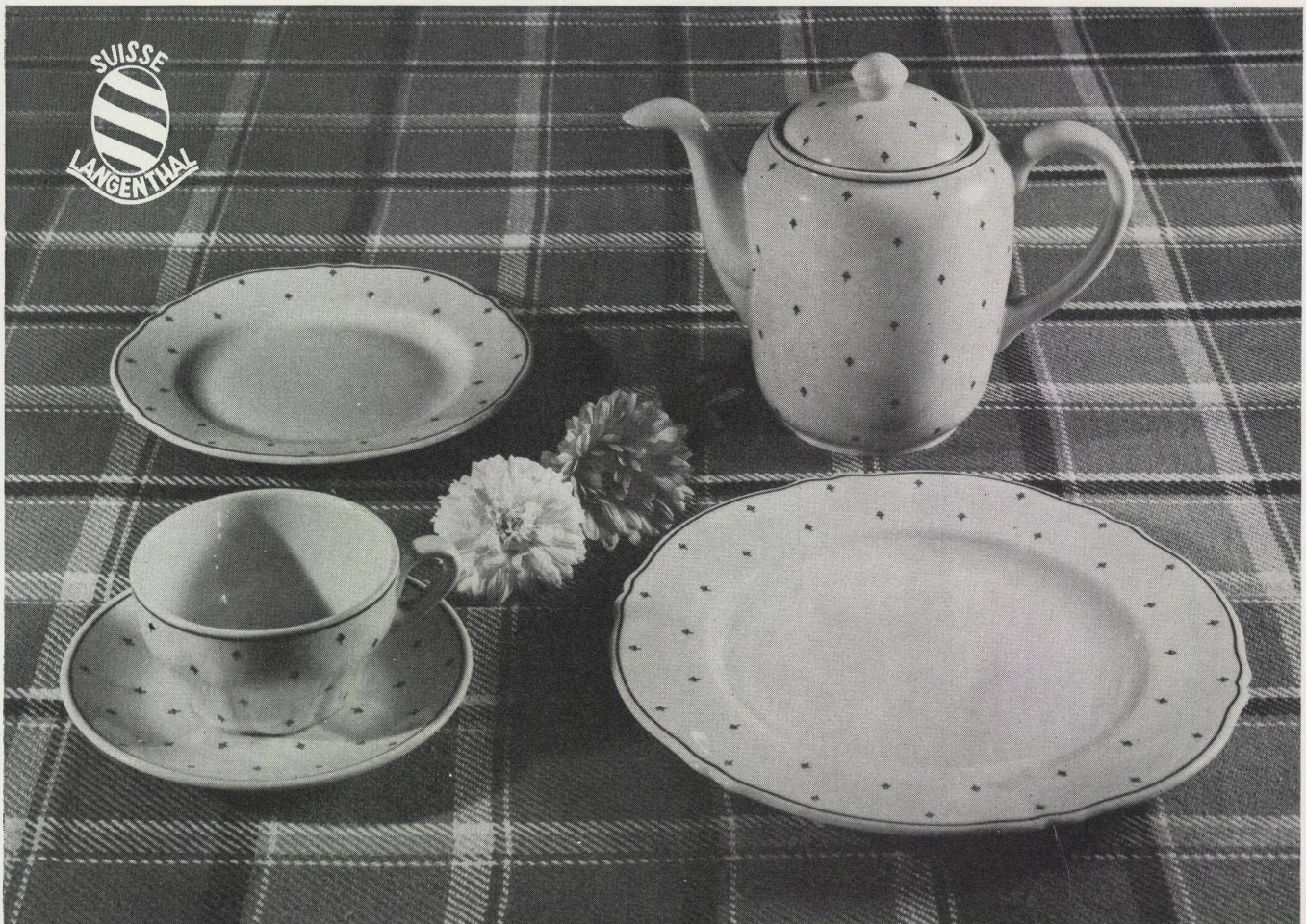
Langenthaler Porzellan für Gastwirtsbetriebe, Kanne mit tropffreiem Ausguß