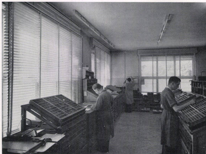
Anwendung der SUNWAY «norm»-Lamellenstoren in einer Setzerei

Durch die C-Form der Lamelle wird eine besondere Lichtwirkung erzielt – die Sonnenstrahlen werden gebrochen und als diffuses Licht weitergeleitet.