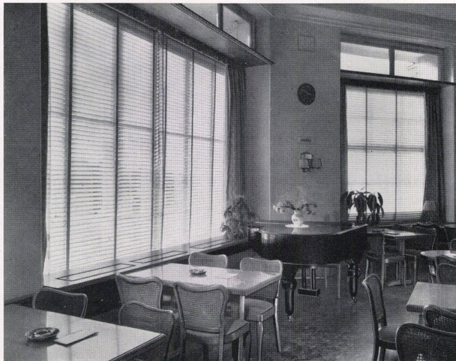
Anwendung der SUNWAY «norm»-Lamellenstoren in einem Tea-Room

Die Lamellen sind mit einem reißsicheren, hitzebeständigen Lack überzogen, die Farbe blättert und bleicht nicht, auch bei andauernder direkter Sonnenbestrahlung. Lochung, Zugschnitt und Formgebung der Lamellen geschehen mit einer Spezialmaschine in einer Operation.