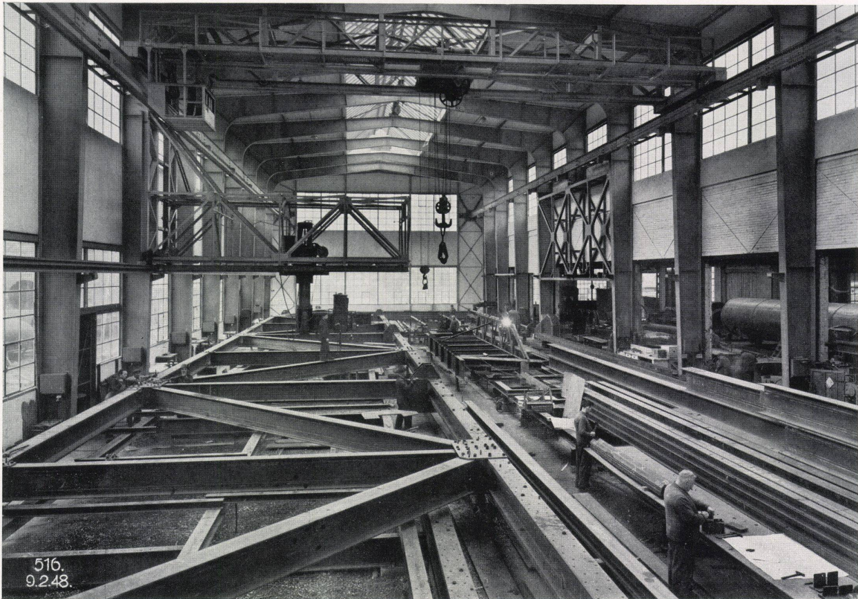
Werkstatthalle III der AG. Conrad Zschokke, Stahlbau und Kesselschmiede, Döttingen, Aargau