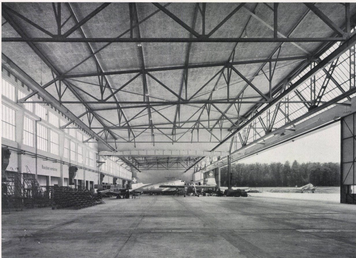
Werfthalle des Flugplatzes Zürich-Kloten (Länge 150 m, Tiefe 37,5 m). Projekt der Stahlkonstruktion durch die AG. Conrad Zschokke, Döttingen. Ausführung in Gemeinschaftsarbeit mit den Firmen Eisenbaugesellschaft Zürich und Geilinger & Co., Winterthur

Wir sind gerne bereit, Architekten über die Verwendungsmöglichkeiten des Stahles im Hochbau ausführlich zu orientieren, damit, dank der Zusammenarbeit von Architekt und Stahlkonstruktionsfirma, auch in der Schweiz vermehrt wirtschaftliche und formschöne Stahlhochbauten erstellt werden.