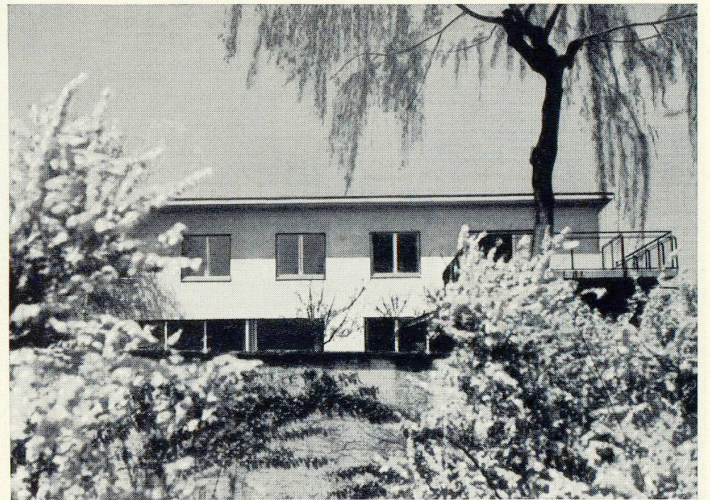
Basel: Eigenheim des Architekten