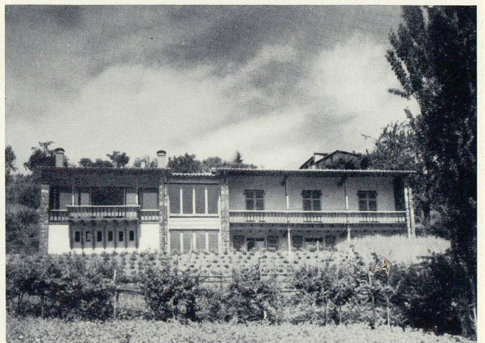
Wohnhaus bei Lugano