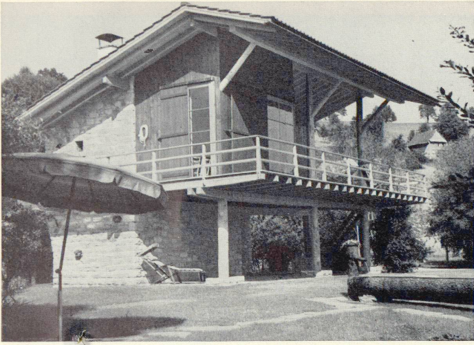
Wochenendhaus am Sempachersee