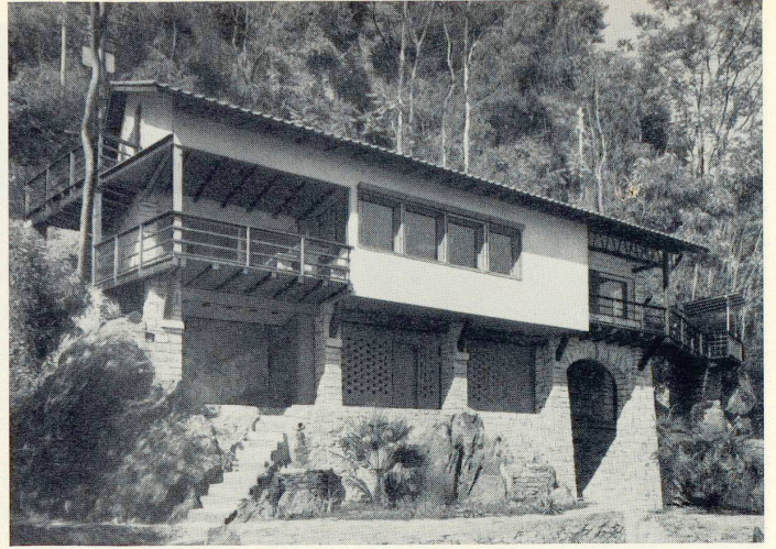
Ferienhaus in Ascona