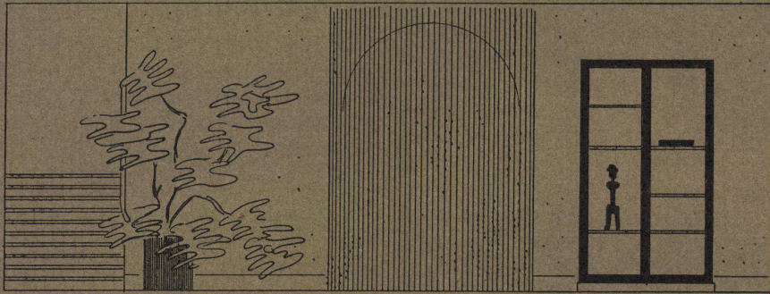
Wandansichten Wohnhalle / Aspects des parois du hall / Hall partitions