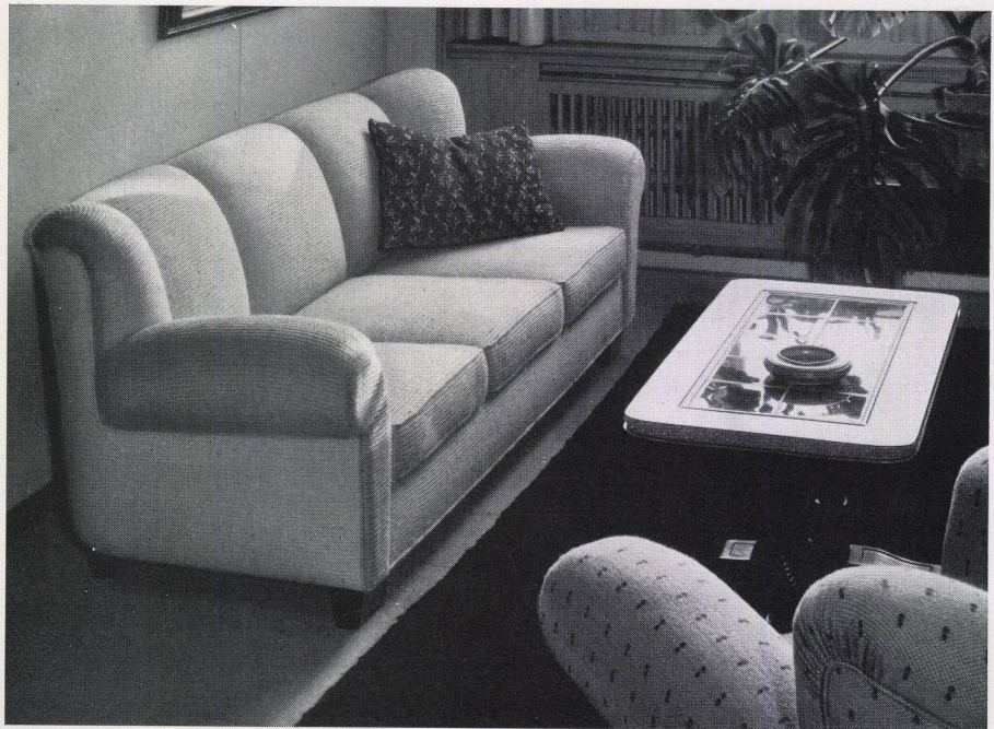
Sitzecke / Fauteuil et divan / Sitting Corner: Modell Kyburz Zürich / Tisca Berber, Tischhäuser & Co, Teufen

Was für eine Wohltat ist es, ein solches Plätzlein in der Nähe zu wissen! Zum Beispiel für Hausfrauen, um die vom Stehen oder Bücken müden Glieder auszuruhen; für Berufstätige, um sich als Ausgleich zum ungesunden Sitzen lang auszustrecken; für Rekonvaleszenten, um hier, warm eingehüllt, das vom Arzt erlaubte Stündlein bequem zu verbringen, oder für irgend jemand, der Feierabende, Ruhetage oder «Leseferien» in angenehmster Weise für Körper, Geist und Seele daheim genießen möchte.