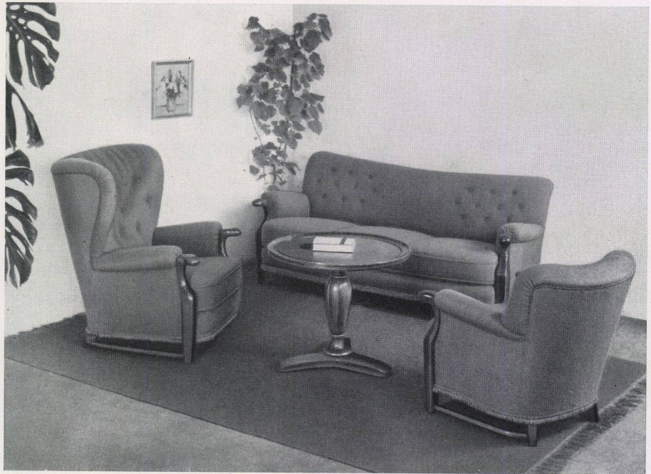
Sitzecke / Coin ou il fait bon s'asseoir / Sitting Corner: Modell Rosenberger und Hollinger, Zürich