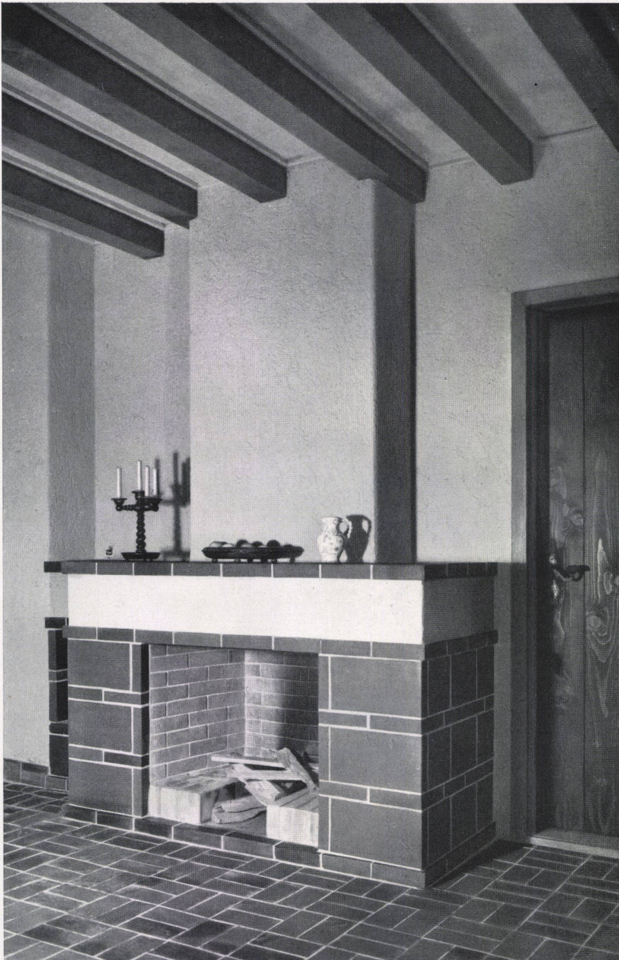
Ein Cheminée in der Wohnhalle. Die bunten Farben des Edelklinkers kommen durch die Unterbrechung mit dem hellen Putzstreifen besonders schön zur Geltung. Cheminée au hall en briques Klinker / Fire-place in Klinker-bricks

Der neuzzeitliche Kachelofen, die angenehme und gesunde Strahlungsheizung ist hier zur Steigerung der Leistung mit Luftzirkulation versehen / Poêle en catelles avec banc chauffé / Tile-stove in modern style.