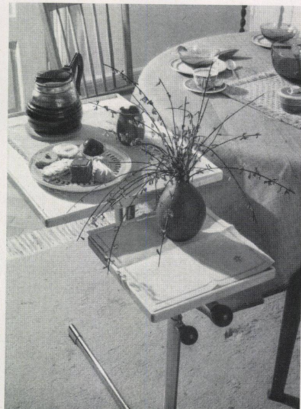
Caruelle -Tischchen für alle Zwecke / Table «Caruelle» à emploi multiple / The Caruelle table serves every purpose