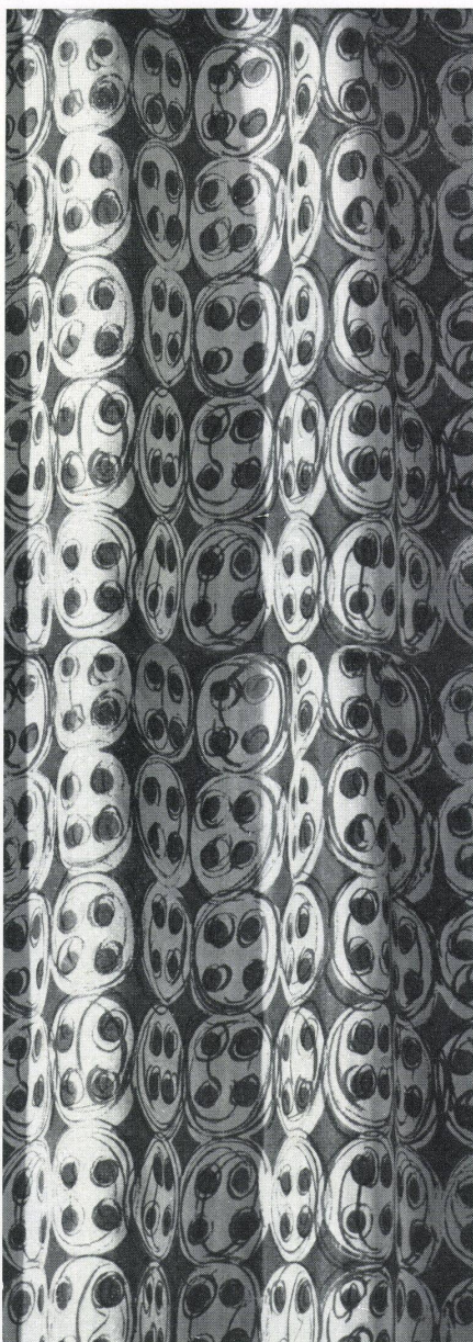
Dessin «Tam Tam» auf Japan-Seide Dessin «Tam Tam» sur soie de Japon Pattern «Tam Tam» on Japanese silk

Wenn heute der einfachen, linearen Form im bedruckten Stoff wieder in vermehrtem Maße eine Bedeutung zukommt, so liegt der Grund darin, weil die neuen Möbelformen einfacher und klarer geworden sind. Wir wollen dabei aber nicht vergessen, daß gerade der lineare Charakter durch das Wegfallen der schmückenden Elemente eine gründliche Formungsarbeit erfordert.