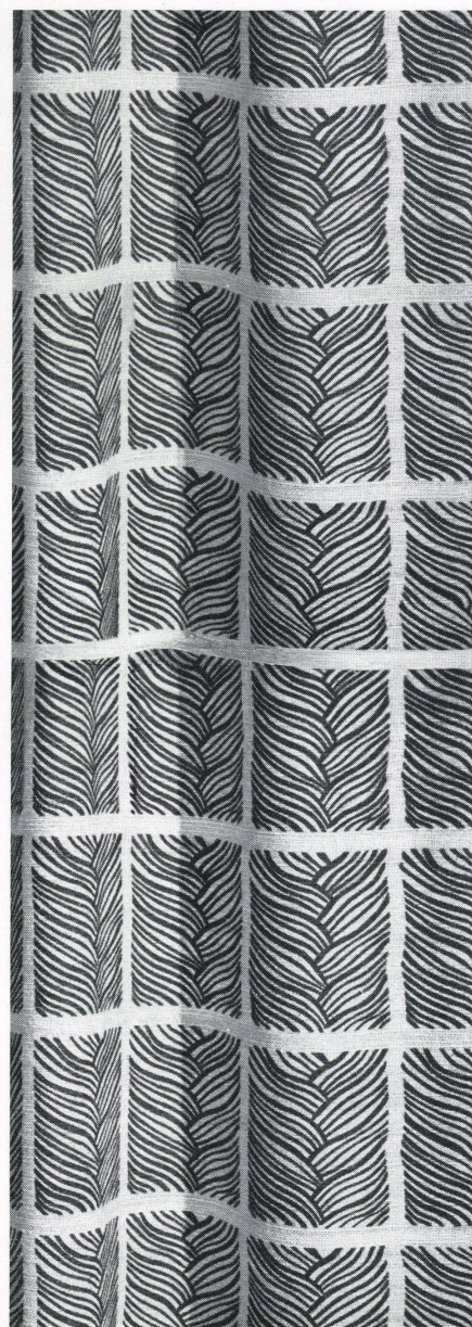
Dessin «Echnaton» auf «Museumleinen» Dessin «Echnaton» sur lin Pattern «Echnaton» on linen