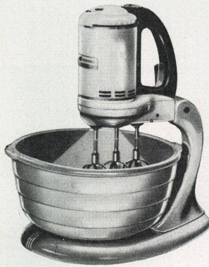
Der G-E Portable Dreischlag-Mixer

Der G-E Portable-Mixer schlägt Eier, schwingt Rahm, mischt Teig, preßt Fruchtsäfte und besorgt viele andere Küchenarbeiten sorgfältig und rasch. Müheles mischt er in der gewählten Geschwindigkeit jedwede Ingredienzen, ungeachtet der Menge oder deren Dicke. Der G-E-Mixer ist der einzige Apparat dieser Art mit drei Schwingern. Der beim Griff handlich angebrachte Mehr-einstellungsschalter ermöglicht ein bequemes einhändiges Einstellen auf die verschiedenen Geschwindigkeiten. Der weiße, feuervermaillierte G-E Portable-Mixer ist mit einer geräumigen Schüssel versehen, deren Inneres mit eingebautem Licht erleuchtet werden kann. Der im Ölbad eingebaute Betriebsmechanismus gewährleistet ein einwandfreies Funktionieren — kein Öl notwendig. Der Fruchtpresser ist in der Normalausrüstung miteinander geschlossen.