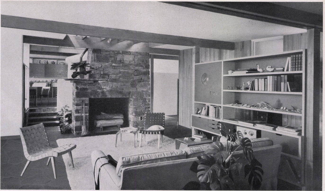
Wohnraum. Links hinten der höher liegende Eßplatz, rechts der Vorraum Living-room. A gauche, au fond, le coin des repas surélevé, à droite le vestibule Living-room. At the back, left, the raised dining corner; right, the vestibule