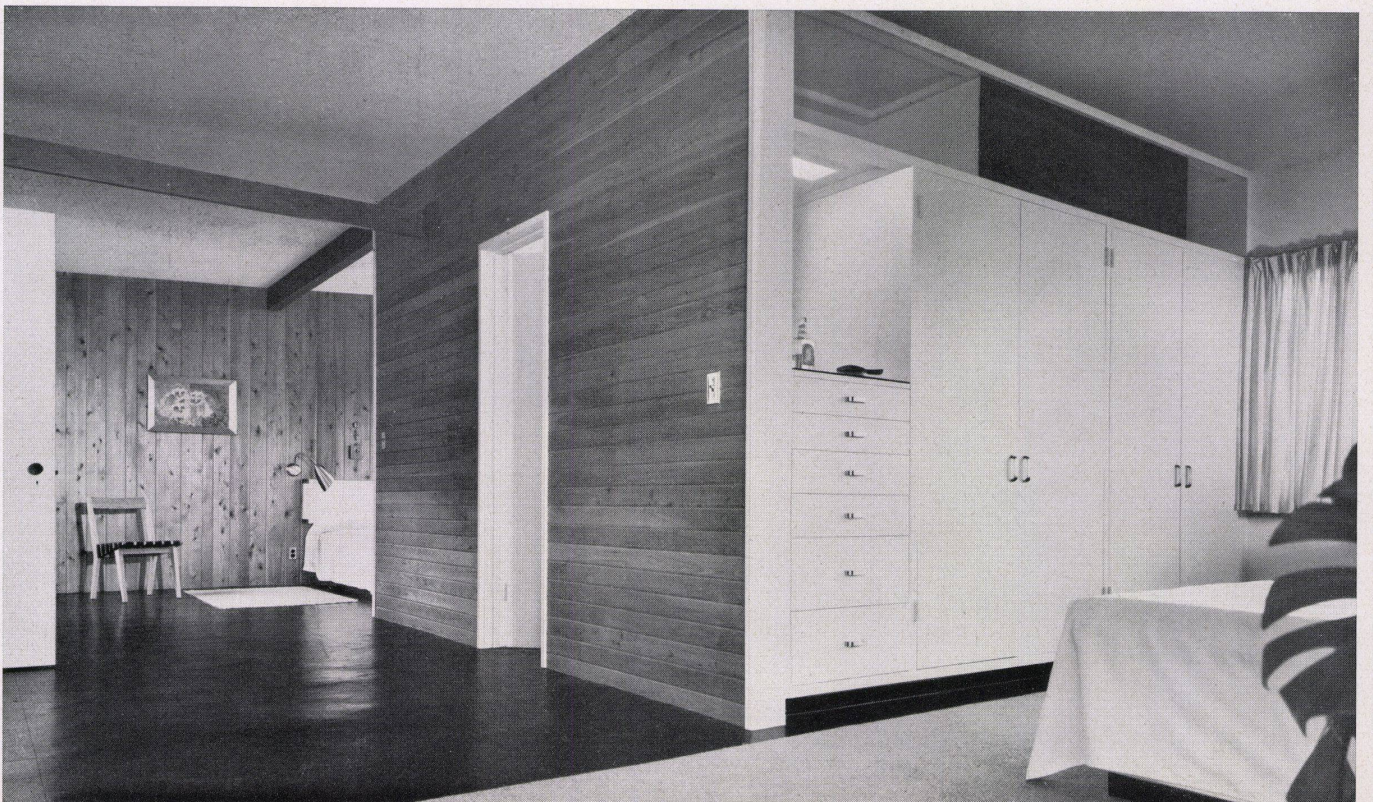
Elternzimmer mit den beiden Schlafnischen und dem Bad- zimmer Chambre des parents, les deux alcôves et la salle de bains Parents' room with two bed niches and bathroom