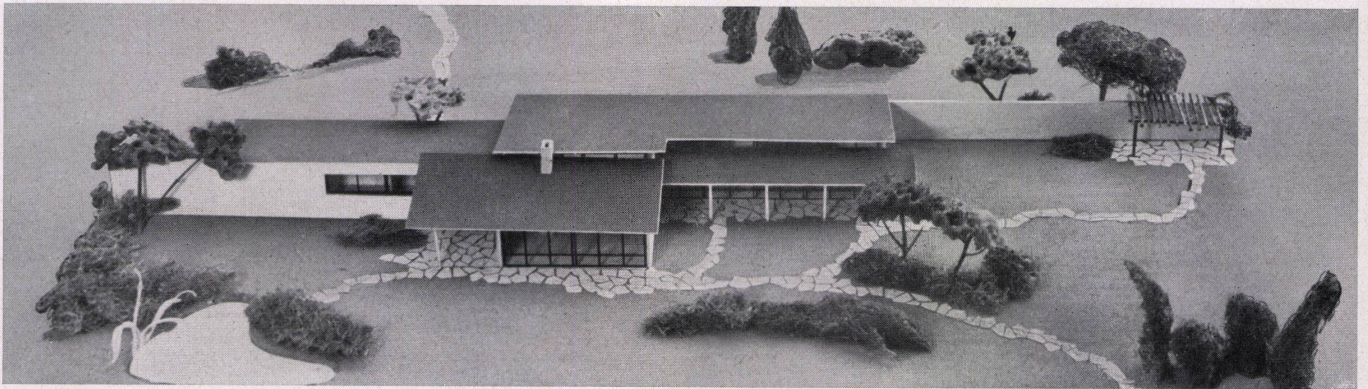
Südansicht mit Wohn- und Schlafräumen Côté sud, salle de séjour et chambres South view with day quarters and bedrooms