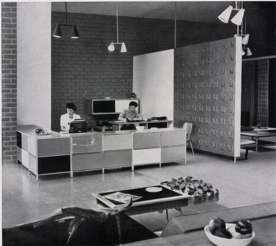
Reception. Im Vordergrund niedriger Tisch mit angebautes Pflanzenbecken. Réception. Au premier plan, table basse combinée avec une jardinière. Reception. Foreground, low table with adjoining plant bowl.

Charakteristisch für die Arbeitsweise der Herman Miller Furniture Co. ist, daß im wesentlichen Architekten mit der Gestaltung von Möbeln beauftragt werden und daher kein Produkt als isoliertes Problem entsteht, sondern als Teil der gesamten Hausplanung gesehen wird.