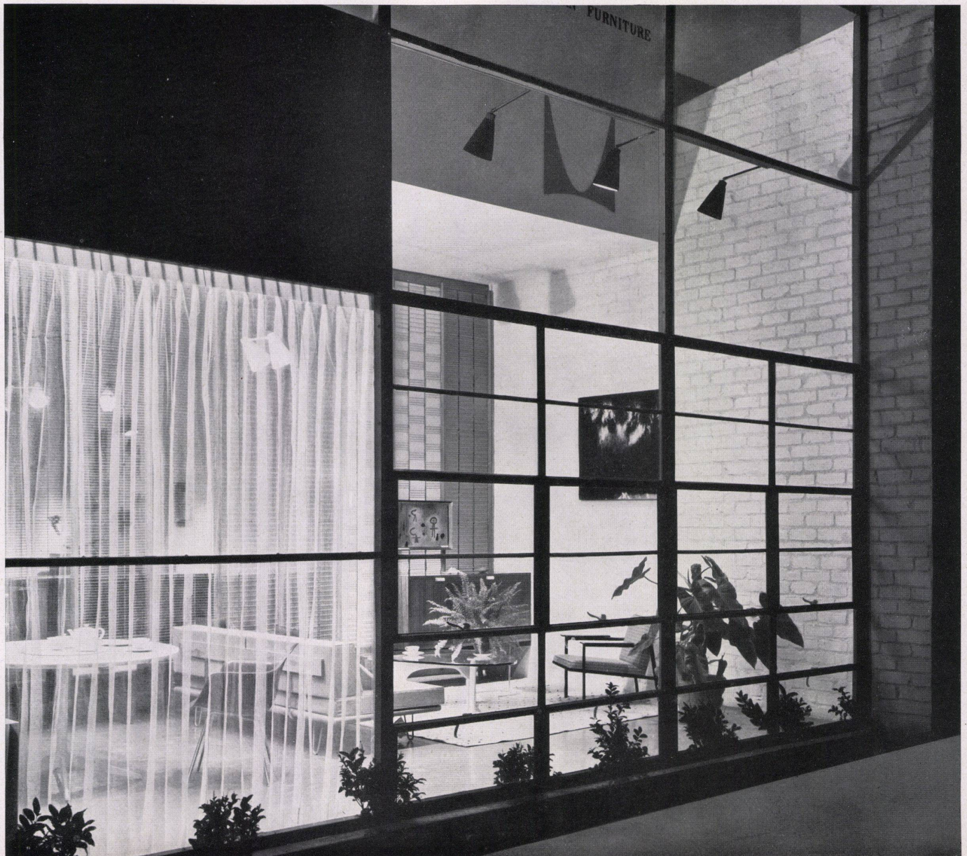
Blick in zwei Ausstellungsräume Vue des deux salles d'exposition View into two show-rooms

Als Dekorationselement werden Blumen und Zweige verwendet. Eine Fotowand sowie ausgesuchte Keramik und Gläser ergänzen zusammen mit Textilien das frische Gesamtbild dieses Verkaufssaales.