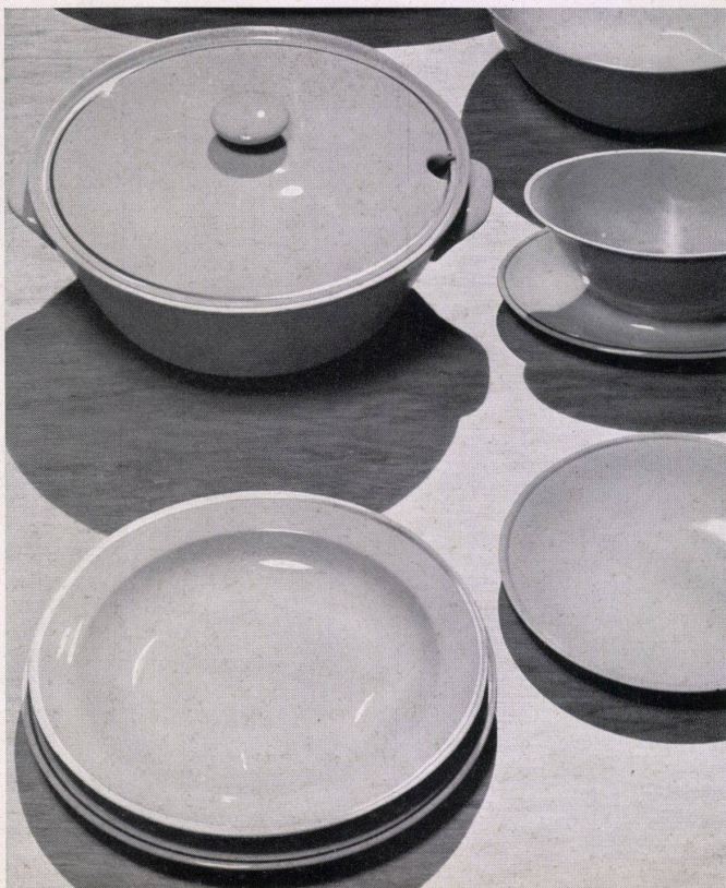
Elfenbeinporzellan Langenthal. Porcelaine ivoire de Langenthal. Langenthal ivory porcelain.

The absence of all decorative elements brings out the full beauty of ivory por- celain and of the configuration of these Langenthal products.