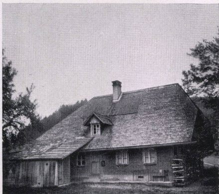
Links Toiletten, rechts Klassenzimmer

Die 111 Klassenzimmer können nur durch Öffnen der Fensterwand korrigiert werden.