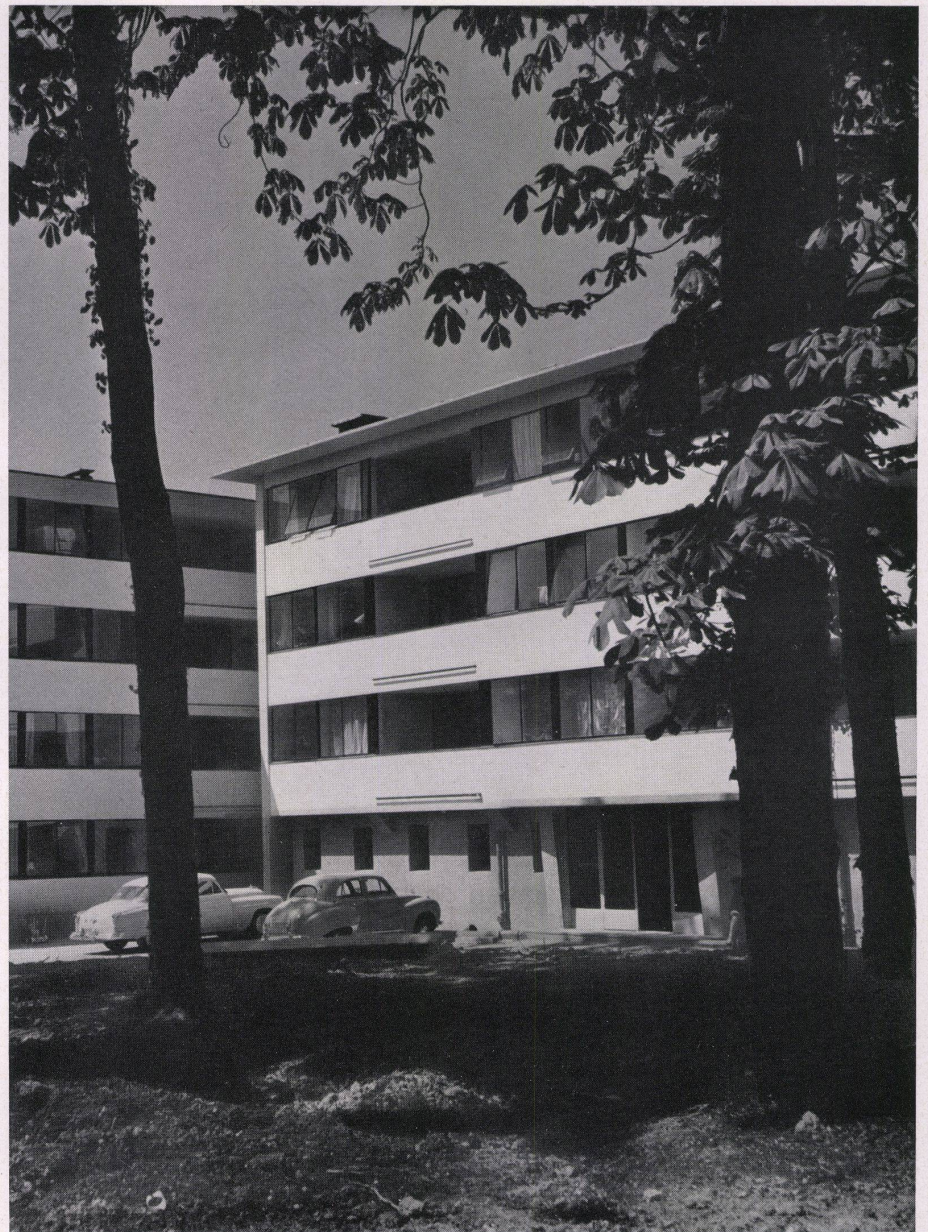
Block 2 und 3. Blocs 2 et 3. Block 2 and 3.