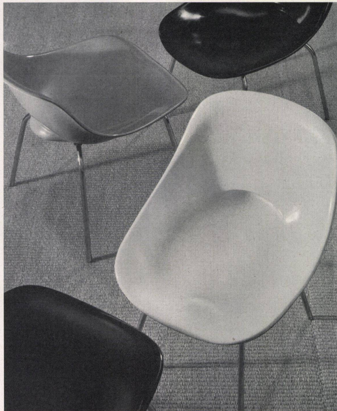
Schalenstühle in verschiedenen Farben