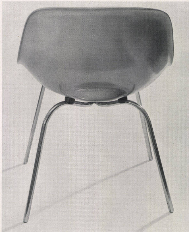
Schalenstuhl Entwurf: W. + E. Guhl, SWB, Zürich