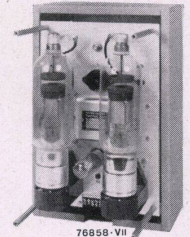
Thyralluxgerät 14 A mit abgenommenem Deckel

Zahlreiche Anlagen im Betrieb Wir beraten Sie gerne