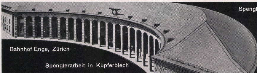
Bahnhof Enge, Zürich

stätte zum Norm-Fenster. Groß- und Detailaufnahmen vermitteln die Vielfalt der einzelnen Arbeitsphasen, aber auch einen vorbildlich organisierten Herstellungsablauf. Zu den eindrucklichsten Bildfolgen gehören hierbei Aufnahmen von einzigartigen Spezialmaschinen, welche zu den neuesten Errungenschaften der Technik zu zählen sind. Der Film wächst förmlich aus den Problemen der fortschreitenden Normierung von Bauteilen heraus, mit welchen er sich eingehend auseinandersetzt. Die filmische Handlung wirkt den ganzen Streifen hin-