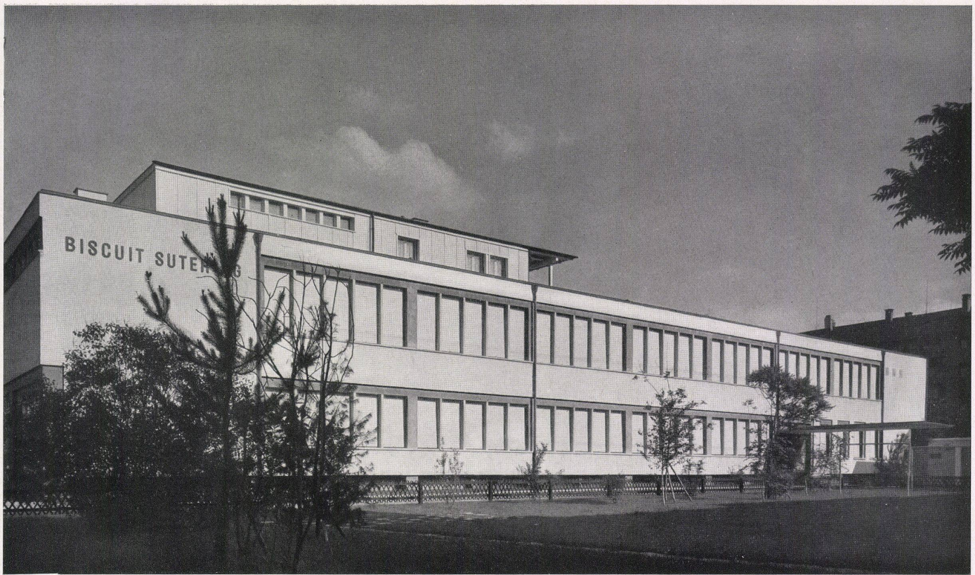
Gesamtansicht. Vue générale. Overall view.