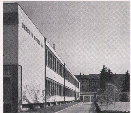
Blick von der Straße gegen den Eingang. Vue de la rue sur l'entrée. Street view towards the entrance.